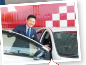
暑い夏が始まりました! 写真は背広ですが クールビズでお待ちします!

入社年月日 平成 23 年 4 月 1 日 出身地 出雲市 趣味・特技 野球をする・観戦 好きなドライブコース 山陰道から見える出雲平野の夜景