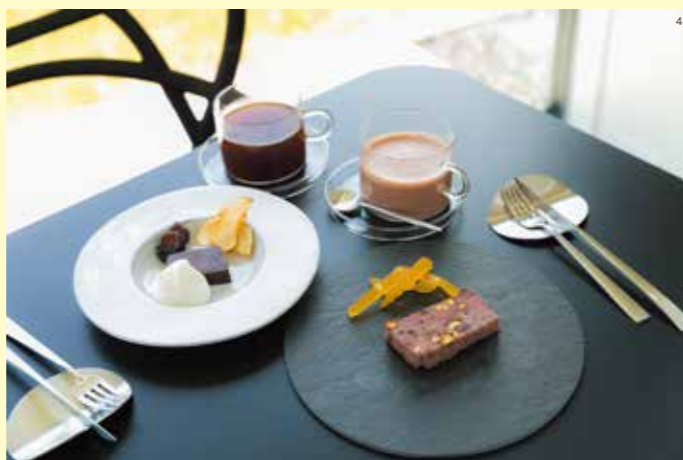
1. 豆の皮むきはすべて手作業 2. パッケージのデザインも自社で作られています 3. 観て楽しむこともできる美術館のような空間 4. カフェメニューには地元の洋菓子店とのコラボスイーツも

ラ・ショコラトリ・ナナイロでは、カカオ豆の買い付けから選別、焙炒、テンパリング、成形、包装までの工程すべて自社工房で製造を行うビントゥバー (Bean to Bar) チョコレートを販売しています。