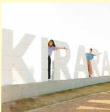
道の駅にできた新しいモニュメントの前で写真を撮ろう！