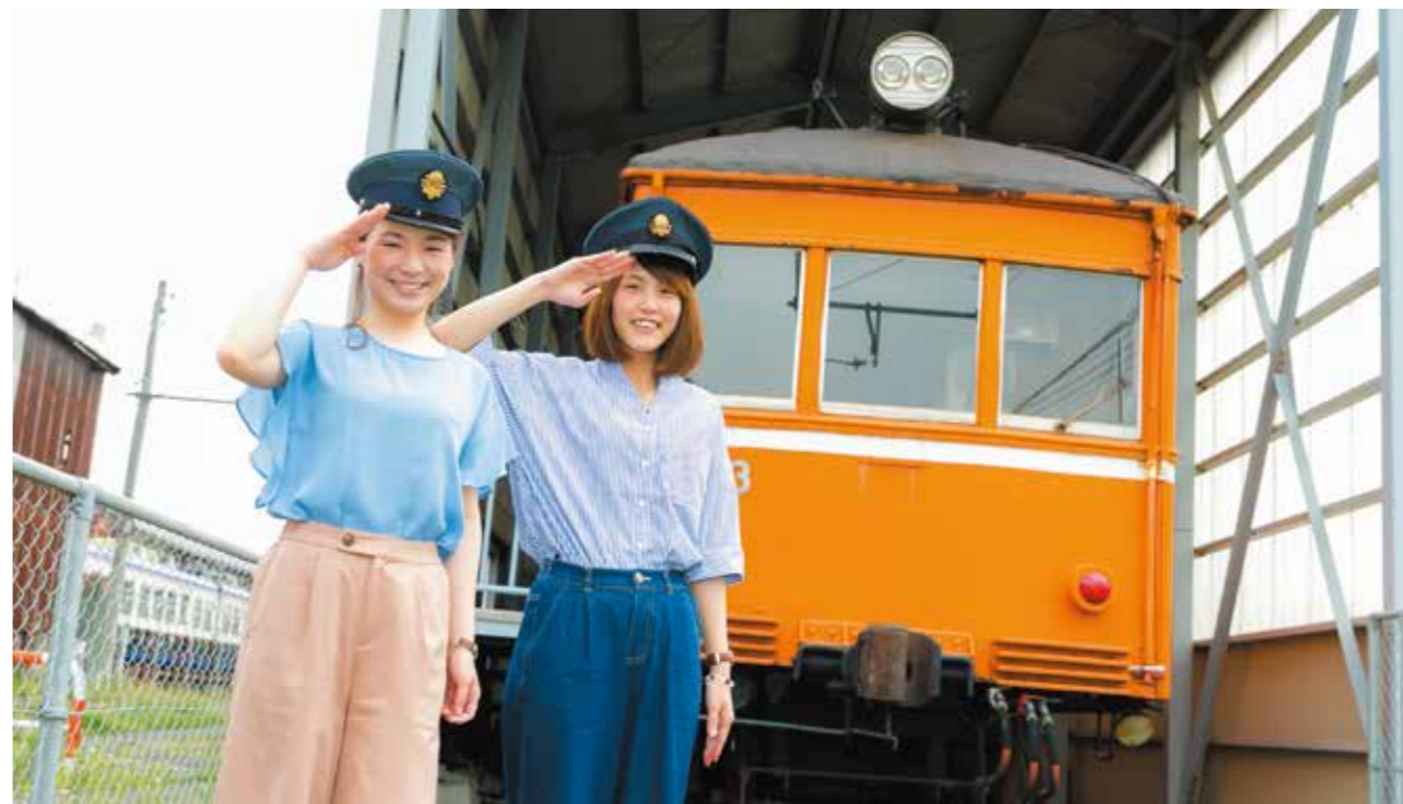
大社線開通に備え昭和のはじめ頃に製造された一畑電車オリジナル車両デハニ 50 形 (車輛形式: デハニ 53)