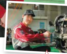
職場の仲間と一緒に 懸崖へ釣りに行き、 大きな魚を釣りました!

入社年月日 平成 20 年 4 月 1 日 出身地 大田市 趣味・特技 釣り・ドライブ 好きなドライブコース キララ多伎までのくびき海岸道路