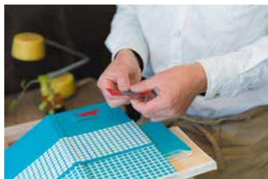
切りはめの柄は、色の違う紙を二枚重ねて切り抜き、互い違いにはめ合わせることで出来上がります。格子状の模様はその作業を沢山繰り返す大変な作業になります…!