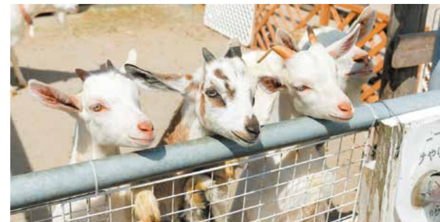
広場は学校行事がある時以外の9時~17時まで開いています。

出雲市の県立出雲農林高校の生徒さんが育てている動物と触れ合える「動物ふれあい広場」。校内西側で犬、猫、鳥、羊、牛など沢山の種類の動物たちが飼育されていて、動物によっては触ったり餌やり体験をすることができます。