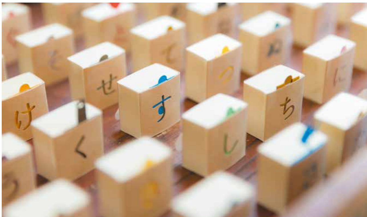
手のひらにコロんと転がるようなサイズのかわいいメモ帳。製本の端材で作られるそうで、カラフルなしおりは形が違うものもありコレクションしたくなります。文字を組み合わせるとギフトにも。メモスタンドとしても使えます!