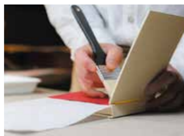
表紙と中身(本文)を繋ぎ、冊子を補強・装飾するための「見返し」という部分を貼る作業は、緊張する作業のひとつ。ここで失敗すると全ての作業が水の泡になるという気の抜けない工程です。