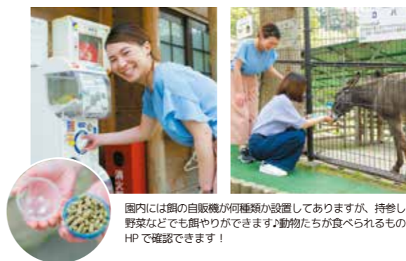
園内には餌の自販機が何種類か設置してありますが、持参した野菜などでも餌やりができます。動物たちが食べられるものはHPで確認できます！

〒691-0001 島根県出雲市平田町 295 http://atagosan.jp/