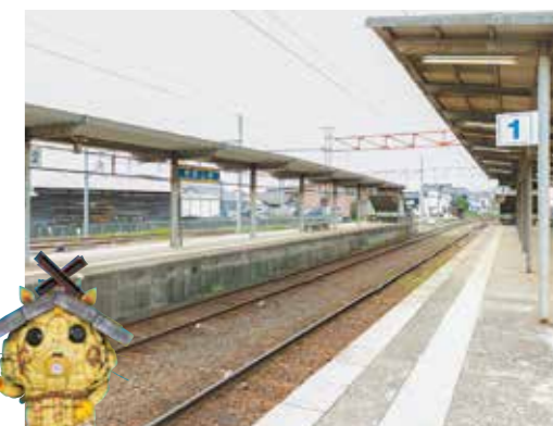
民俗芸術「一式飾り」が展示されています。入場券を買ってホームの見学ができます。