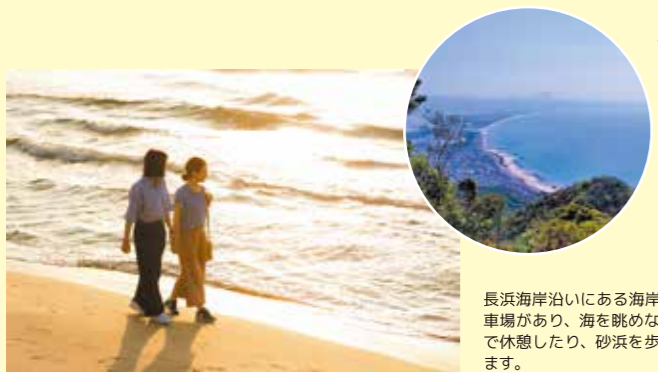
長浜海岸沿いにある海岸公園には駐車場があり、海を眺めながらベンチで休憩したり、砂浜を歩いたりできます。

〒693-0041 島根県出雲市西園町上長浜 4258 ☎ 0853-28-0383