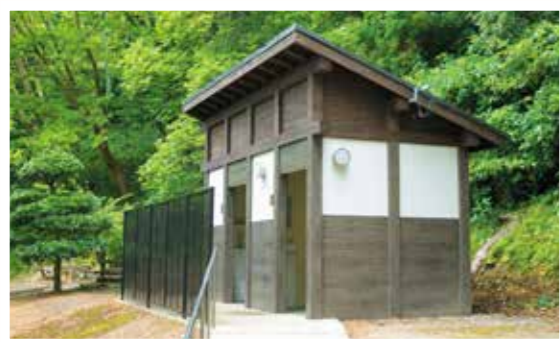
キャンプであると嬉しい水洗トイレ。無料で使えます。