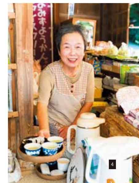
素敵な笑顔でお茶を勧めてくれる売店のおかみさん。