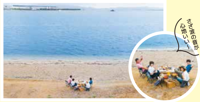
目の前には中海。遊歩道もあり、お散歩できます。