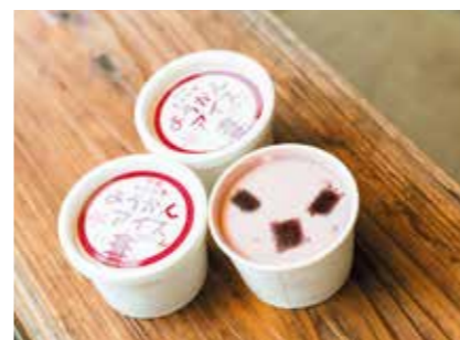
夏期限定で販売している「きよみずようかんアイスクリーム」。清水羊羹が練り込まれたアイスの上にサイコロ状の羊羹が乗っています。ずっくりした甘みと食感が楽しめます。