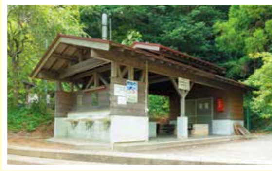
水道・調理台・かまどがあり、無料で使えます。