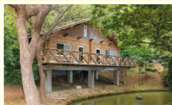
申込みをしておくともシャワー室が利用できます(有料)