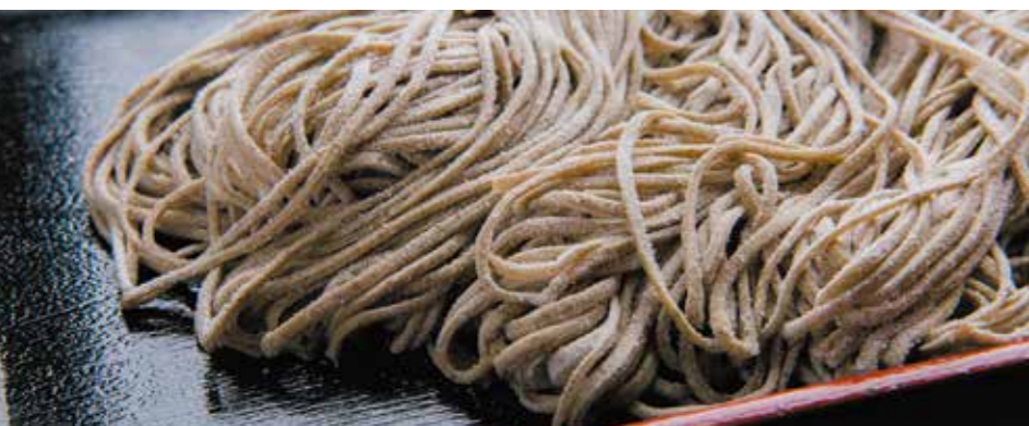
「挽きぐるみ」によって実ごと製粉されたそば粉は、色が濃く香り高いのが特徴。かみしめるほど味わいの増す麺に仕上がります。