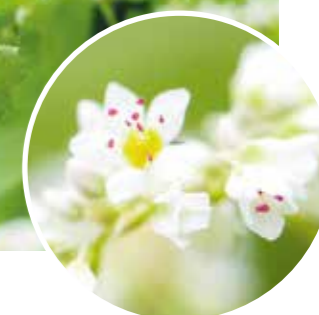
西日本のうどん圏にありながらそば処として名高い島根県。松江市郊外には休耕田を利用したそば畑が広がります。