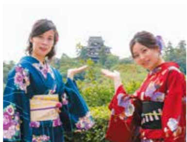
松江城 ビュースポットも あります！