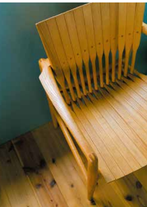
2年という歳月をかけて作られたこちらの椅子は、コンペでも賞をとられた作品だそうです。座面が木でありながら、身体によく馴染み思わす顔がほころぶ座り心地です。

木工所でもなければ、伝統もない：家具にける情熱はあっても、思ったようにお客さんを引き止められず、商品の良し悪しを含めて自分の立ち位置に悩んだ時期もあったそうです。万人に受け入れてもらえるものは、なんだろう？ヒントになったのは、自分が使いたい欲しいと思えるもの。そんな視点で作り始めると次第にお客さんの反応も変わってきたのだとか。 現在オーダー品を作る際にも、自分が使いたいかどうかという感覚を大切にされているそうです。