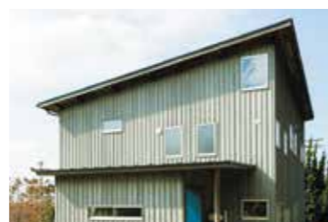
2階建ての工房へお邪魔すると、1階は木の香りのでいっばいの作業場、2階は鳥井の町が見える緑側が印象的な素敵な空間が広がっていました。