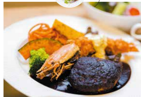
人気のメニューは MIX プレートランチ。嬉しいデザート付きです!