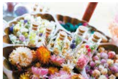
予約無しで1つ200円から店内で体験できるワークショップ。お気に入りの植物をガラスの小瓶に詰めて自分だけのオリジナルを作ってみませんか?