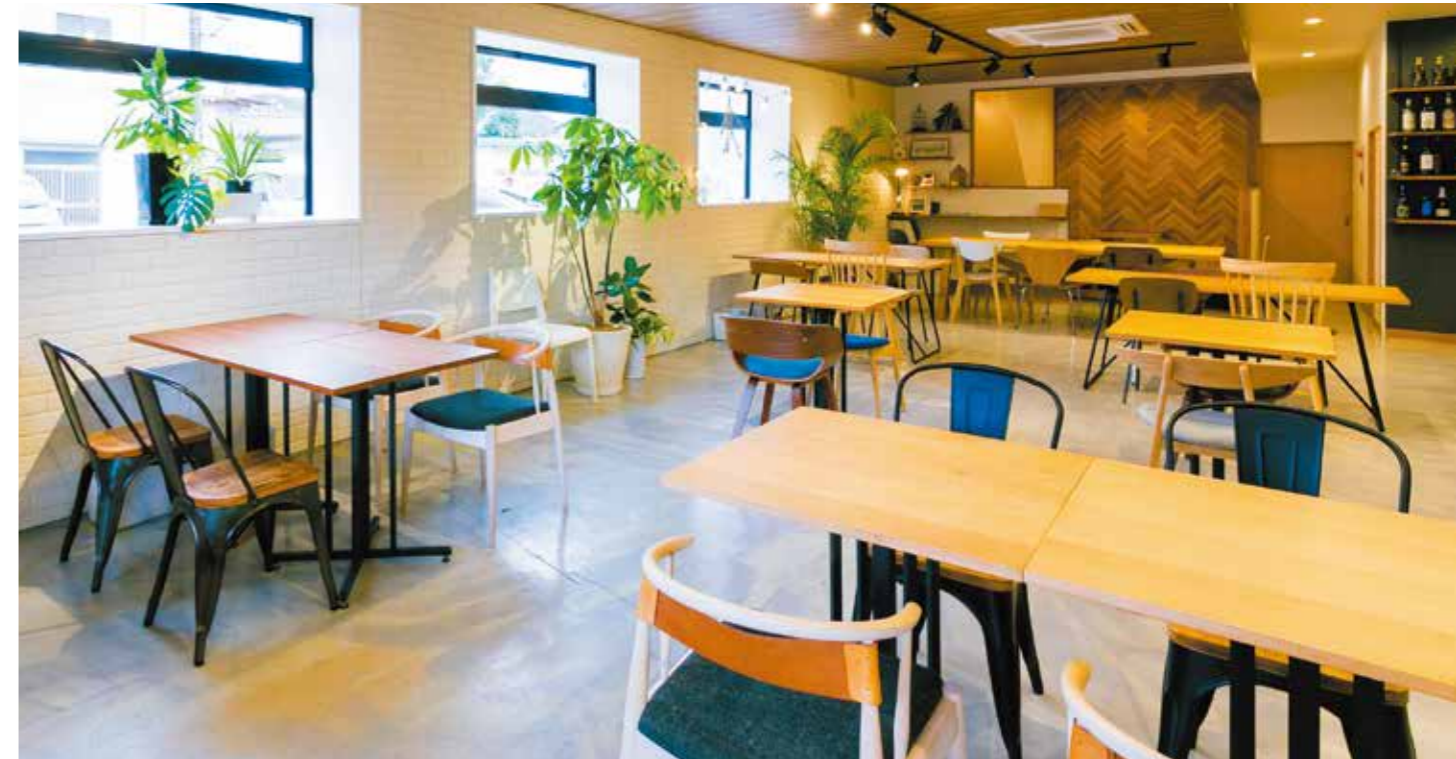
一つひとつ素敵な席が並ぶ店内。京都のお気に入りだったカフェで受けた影響だそう。店内家具の中でも、カウンター・チェアとスクエアテーブルは鳥ヶ丘製作所さんをお願いして作られたものだそうです。