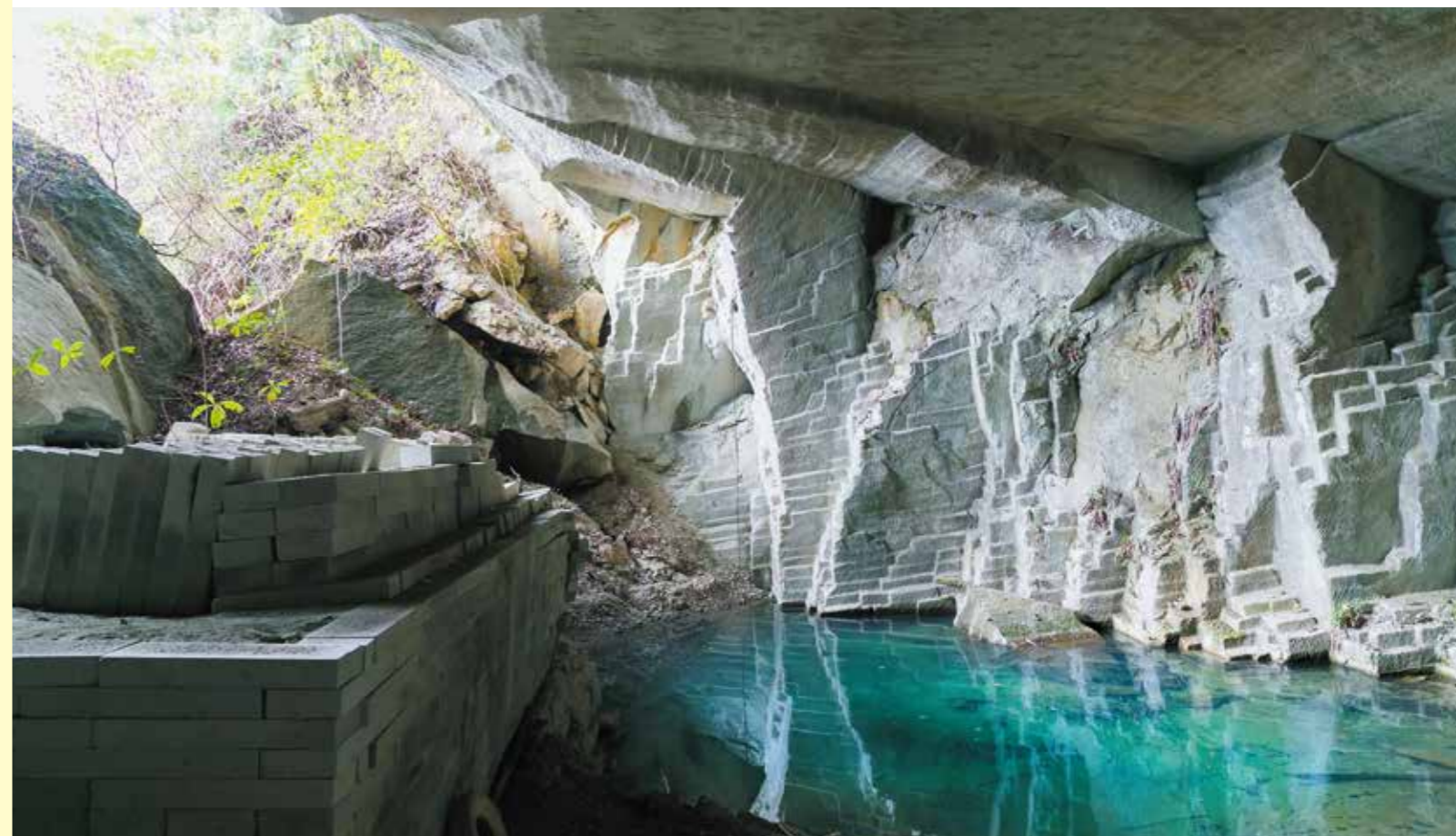
手彫りの採石跡が残るこの池は、岩の隙間などからしみ出た透明感のある山水が溜まっています。

岩山の間を潜ると広がる巨大地下空間に一步足を踏み入れれば 今と昔が共存する不思議な世界へ