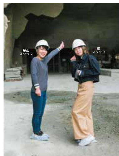
ヘルメット、シューズカバーをつけてガイドツアーへ出発！