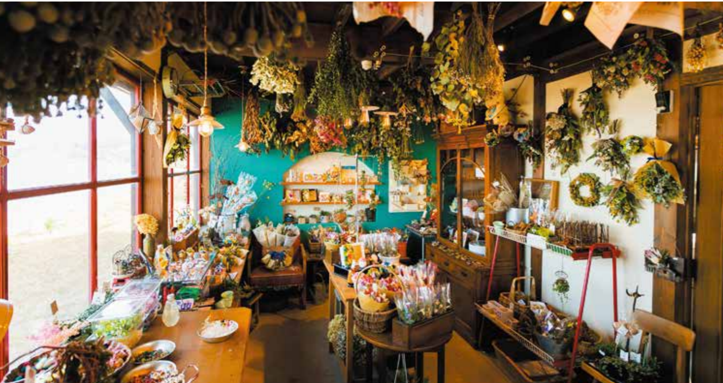
色とりどりの店内にうっとり…並んでいるアイテムたちはどれも可愛らしく、プレゼントや自分用にも最適。時間を忘れて見入ってしまう人も多いのではないのでしょうか。