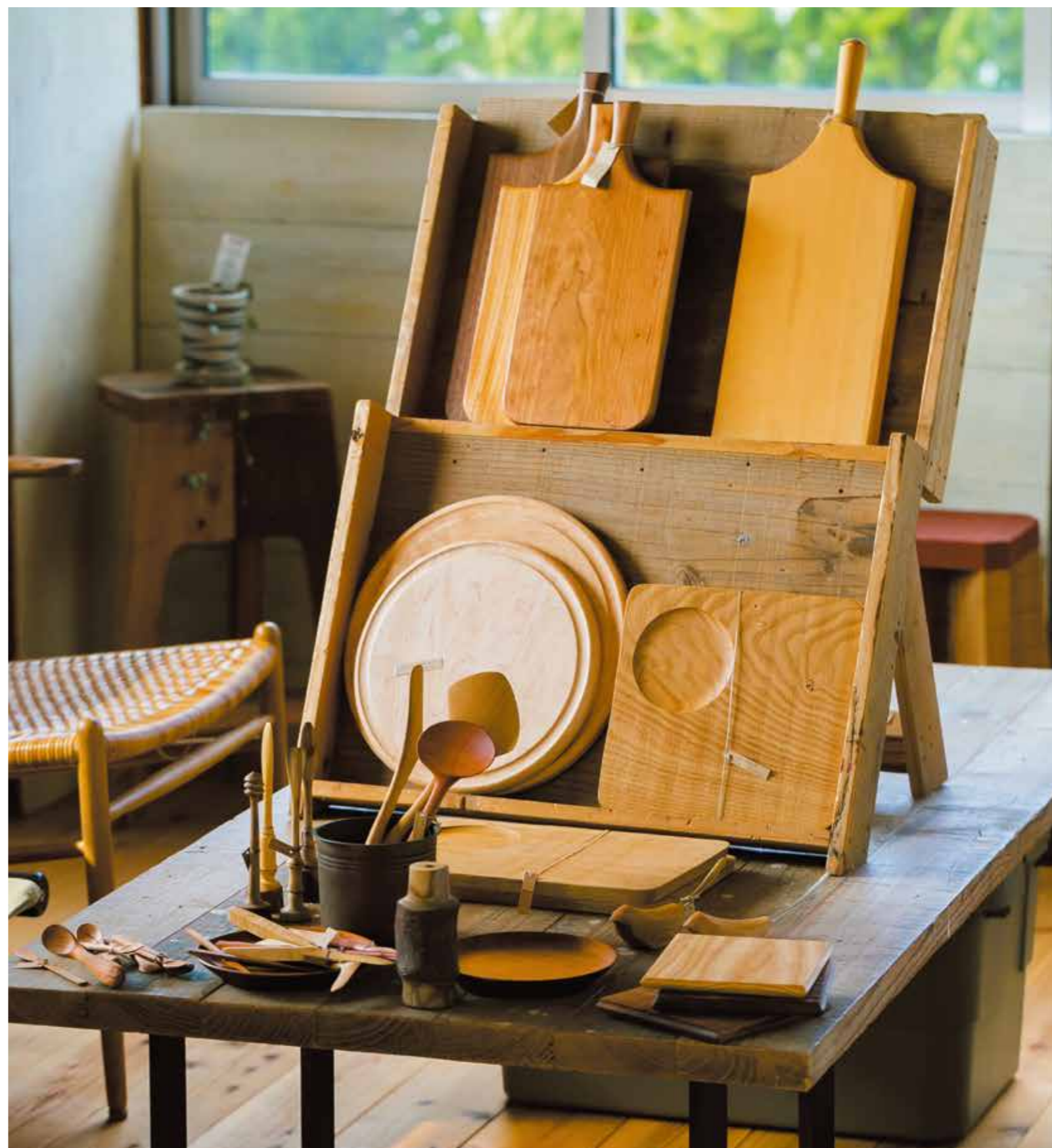
工房に並ぶ椅子や食器・コースターなどは、どれも素敵で個性的なものばかり！無意識に木目や形を指でたどってしまい、なかなか目が離せません…！