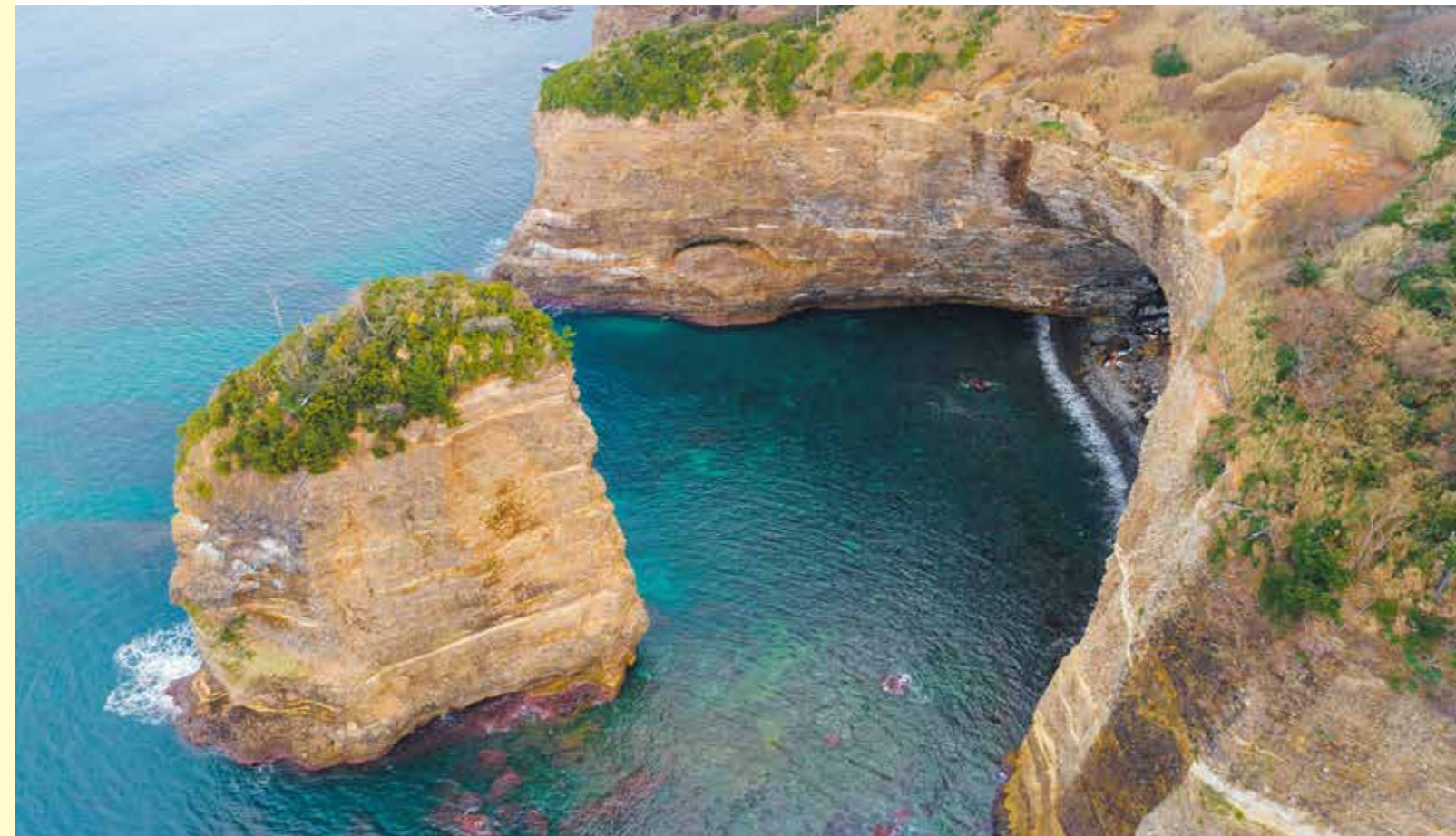
上空から撮影した立神岩。地上からは想像もつかない形状をしていて迫力があります！

大田市の自然が生み出した不思議な石たち。ドライブを楽しむ際の目的地のひとつに加えてみてはいかがでしょうか？