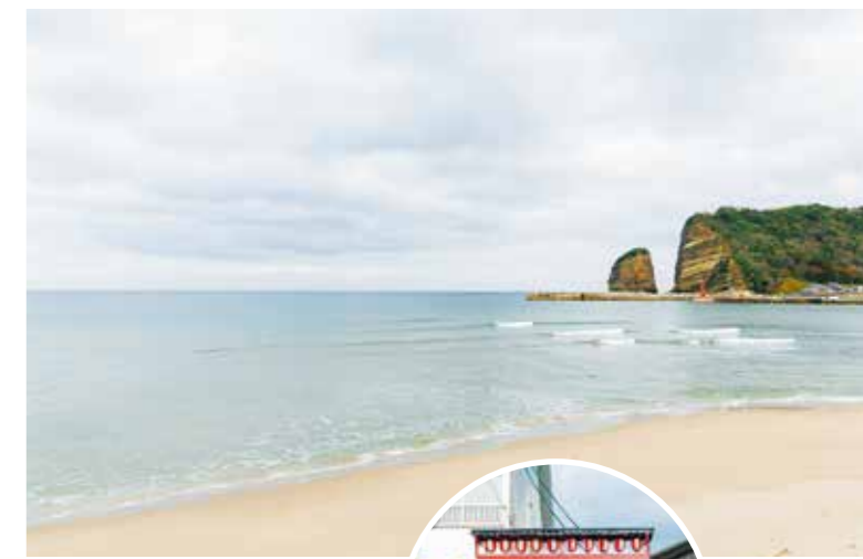
JR波根駅すぐそばにある小道を抜けると水平線が一面に広がり、砂浜を歩きながら立神岩を見ることができます。

大田市波根町中浜にある、波根海水浴場から北の日本海方向を望むと、海岸沿いにしましま模様の大きな立神岩(たてがみいわ)がそびえているのが見えます。この岩は高さ約80メートルあり、向かい側の烏帽子のような島は立神島と呼ばれています。日本列島が形成されつつあった1500~2000万年ほど前に繋がった状態で形成され、長年にわたり日本海の荒波に削り取られて、岩が二つに割れたような現在の形になったと考えられています。力強く、荘厳な姿をした立神島と立神岩は地元のランドマークであり、大田市の景観の一つになっています。