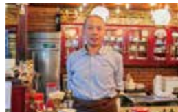
創業50年！老若男女問わず広い人気を集めています。

〒699-0822 出雲市神西沖町2107-1 ☎0853-43-1353 🕒8:30~18:00 🗓️木曜日・毎月第2金曜日