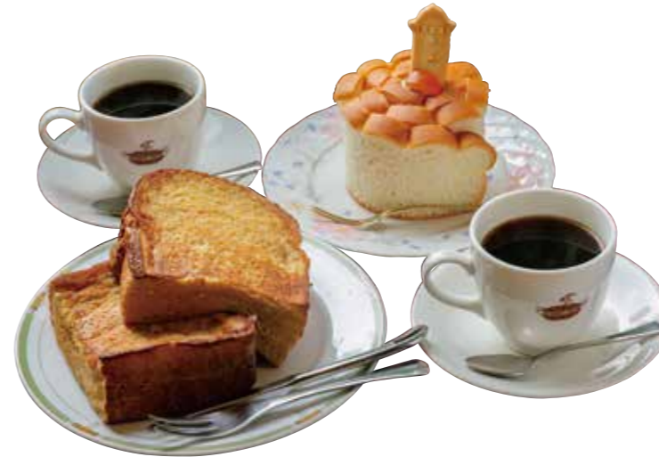
フレンチトーストセット (モーニングメニュー) 税込 660円

〒693-0035 出雲市芦渡町653-5 ☎0853-25-2528 🕒8:30~17:00 🗓️土曜日PM、日祝曜日 年末年始休み有り