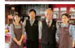
昔馴染みのお客様にあの頃ののままの場所を提供したいと、店内は創業当時と変わらない雰囲気。

〒693-0004 出雲市渡橋町1223-1くにびき第一ビル ☎0853-24-1760 🕒8:00~18:00 🗓️日曜日 年始のお休み 1/3まで http://www.fujihiro-coffee.co.jp/ http://fujihiro-coffee.blog.jp/