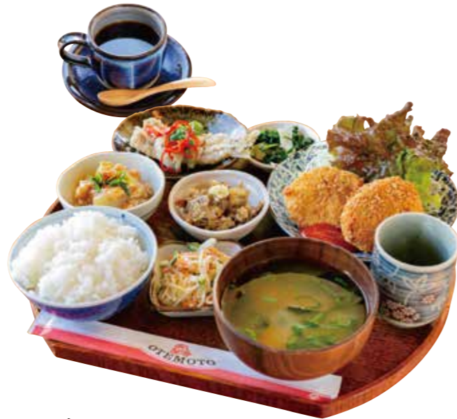
ホットコーヒー 税込 300円

〒699-0822 出雲市神西沖町2107-1 ☎0853-43-1353 🕒8:30~18:00 🗓️木曜日・毎月第2金曜日