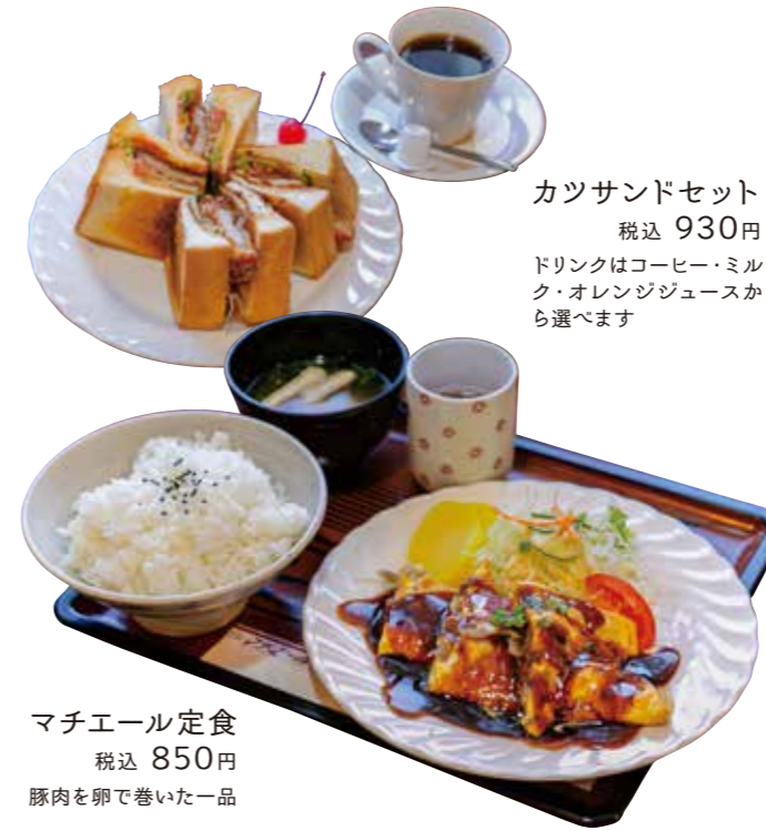
カツサンドセット 税込 930円 ドリンクはコーヒー・ミルク・オレンジジュースから選べます

〒699-0624 出雲市斐川町上直江3321 ☎0853-73-3772 🕒9:00~18:00 土・祝 8:00~18:00 (平日、土曜祝日共に売次期間店) 🗓️日・月曜日