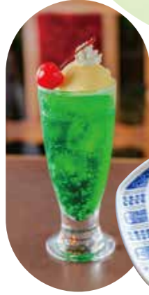
クリームソーダ 税込 500円