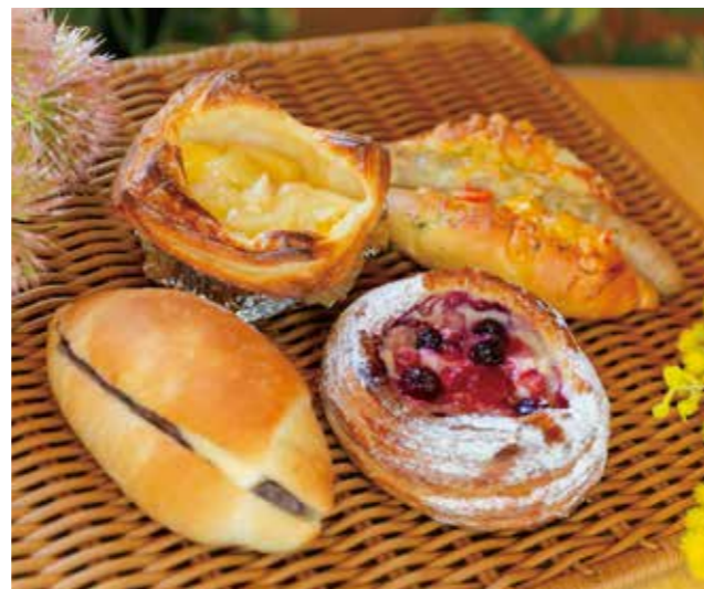
(右上) ハーブウインナーのバジルチーズドッグ 税込 270円

〒693-0012 出雲市大津新崎町6丁目2-1 ☎0853-30-0141 🕒7:00~16:00 🗓️月曜日 ※年始の営業についてはお問い合わせください