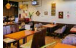
店主の趣味が高じて40歳でお店をオープン。お客様と料理について話す時間が何よりも幸せなんだとか。

〒693-0035 出雲市芦渡町653-5 ☎0853-25-2528 🕒8:30~17:00 🗓️土曜日PM、日祝曜日 年末年始休み有り