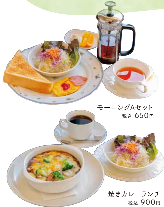
モーニングAセット 税込 650円