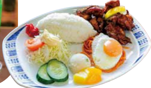
唐揚げランチ 税込 1,000円