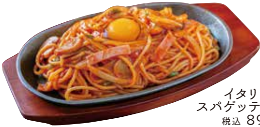
イタリアン スパゲッティー 税込 890円